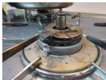
きれいにはまっている状態