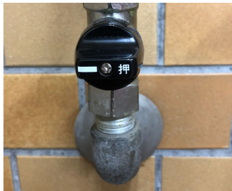
栓が閉まっている状態